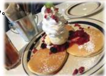
△写真はイメージです。