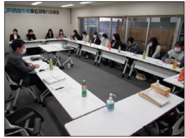
本部・支部・分会の女性役員が集結し、意見交換を実施

JR四国労組では、2008年に「男女平等参画推進委員会」を設置して以降、今日まで男女平等参画推進に向け各種取り組みを行ってきた。 直近では、連合「ジェンダー平等推進計画」の達成に向け、JR連合とともに「第4次男女平等参画行動目標」を定め、「各組織における女性役員の選出」「各種議決機関への女性参画」「男女平等参画推進に向けた取り組み」の3点を目下の目標として、連合「中央集会」・JR連合「女性役員意見交換」を初めとする各種活動を参画するとともに、JR四国労組としても性別問わず働きやすい環境作りに向け「JR四国労組男女平等参画推進会議」のほか、以下のような活動を実施している。