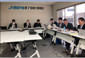
zoomによるWEB形式での開催

【議事】 ①丸亀市議会議員選挙における推薦候補者の承認について ②36協定の妥結承認について ③営業施策に関する付議について ④ダイヤ改正に関する諸問題の集約について ⑤JR四国労組第44回定期大会の招集について ⑥2025年度新規採用者の全員加入に向けた取り組みについて ⑦「四国の新幹線の『早期整備』を求め署名活動」の取り組みについて ⑧春季レクレーション2025の開催について ⑨当面するスケジュールについて ⑩その他