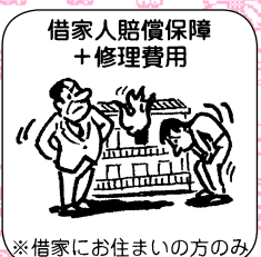
借家人賠償保障 +修理費用