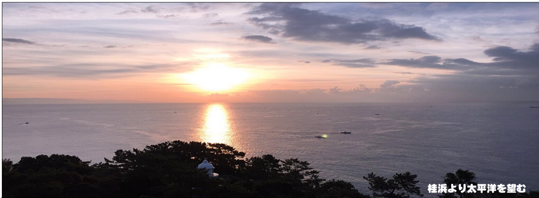
桂浜より太平洋を望む

〒760-0021 高松市西の丸町11-9 TEL (NTT) 087-851-1378 (JR) 086-2597~2598 http://jrсу.jrsis.com/ 発行責任者 / 中濱 斉 編集責任者 / 幸 大