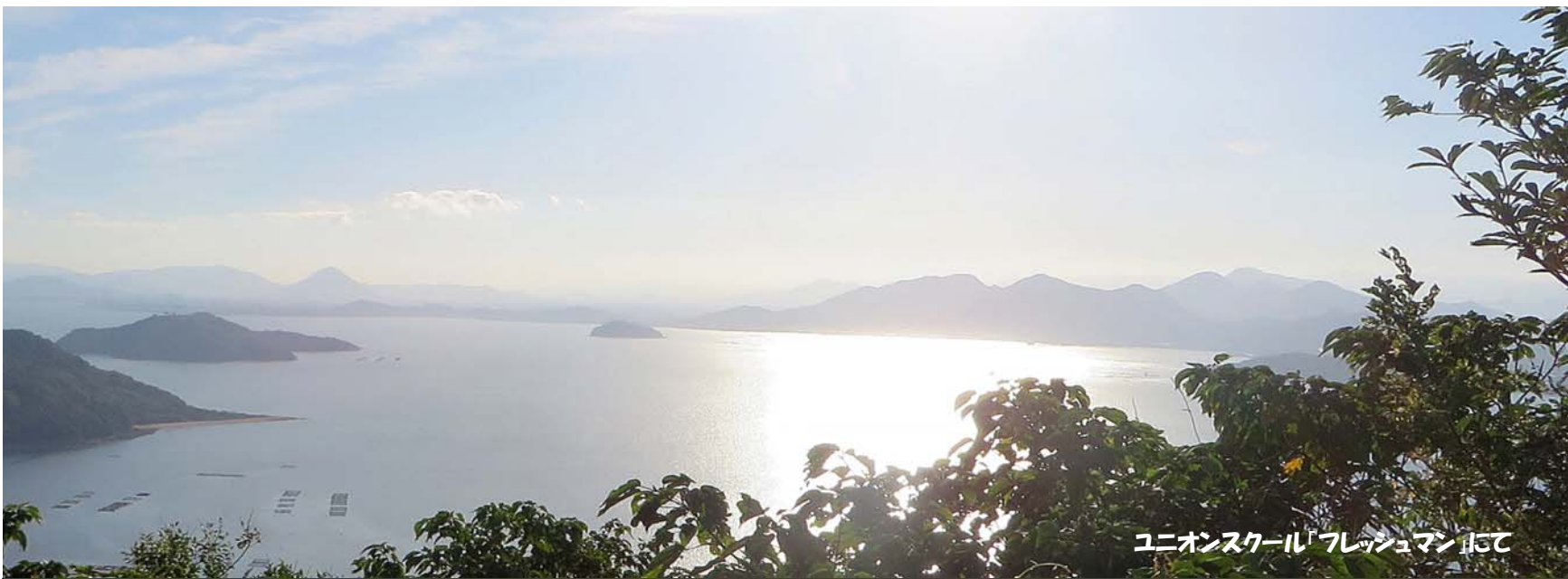
ユニオンスクール「フレッシュマン」にて

〒760-0021 高松市西の丸町11-9 TEL (NTT) 087-851-1378 (JR) 086-2597~2598 http://jrso.jrsis.com/ 発行責任者 / 中濱 斉 編集責任者 / 幸 大